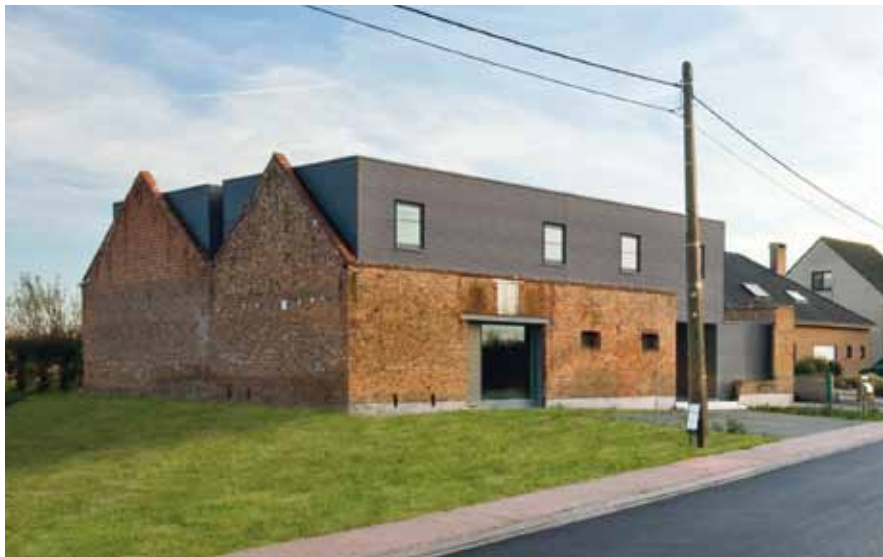
Tekening: MarS Architecten bvba, België.